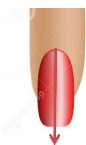
Fig.1: metodo corretto